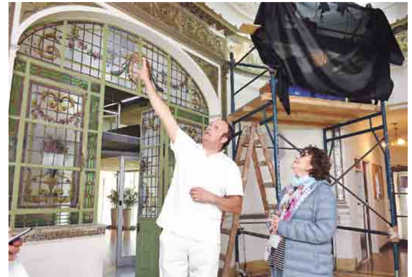
"Hay figuras que están prácticamente perdidas que no se pueden recuperar y debemos definir cuál va a ser el método de intervención. Lo más importante que se debe hacer es la consolidación de la película pictórica que se está desprendiendo".