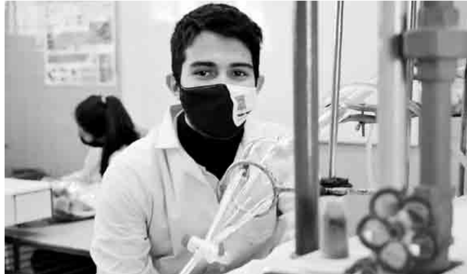
El joven de la ciudad de Santa Fe se clasificó a las Olimpiadas Internacionales de Química que van a realizarse en julio, de manera virtual y organizadas por China.

A pesar de ser entrenamientos en equipo, y estar todos juntos en Buenos Aires mientras se desarrolla la competencia, la participación es individual e incluye “una parte teórica múltiple choice acompañada