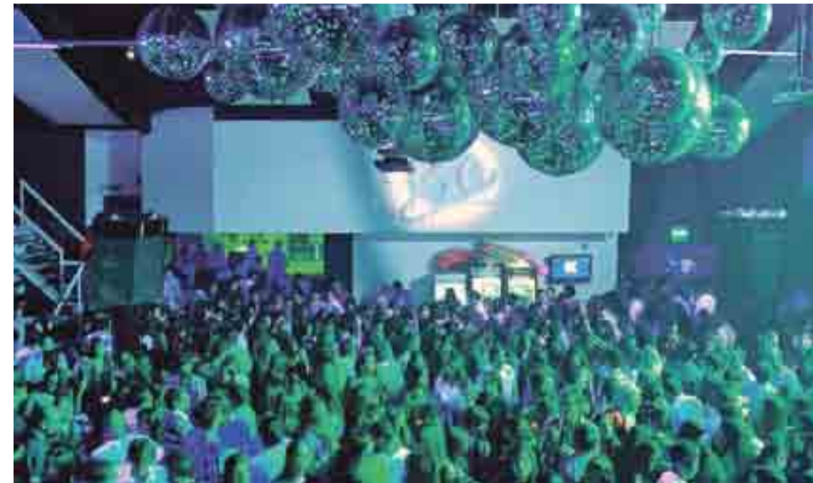
Una “noche ordenada” es el plan en el cual trabaja el municipio local. Los ruidos molestos con afectación al público, uno de los puntos más delicados.

La resonancia entonces es una amplificación del sonido por medios mecánicos, y el ruido puede ser mayor en el interior de la casa que en el exterior. Pero además, “al oído llega no sólo la onda sonora directa de la fuente de ruido, sino también