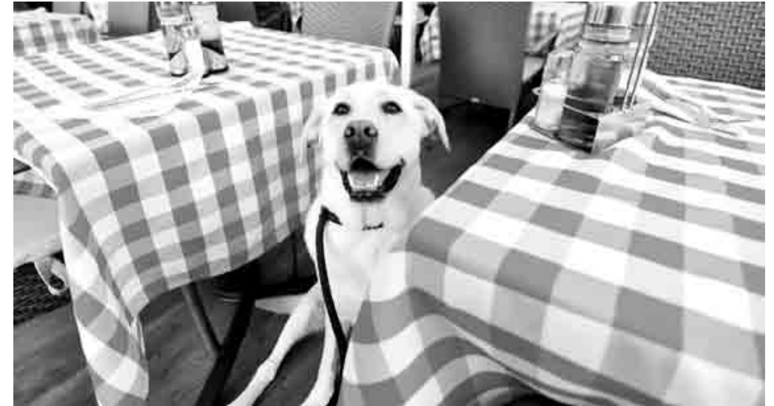
Al ser optativo, los propios comercios deciden si sumarse a la figura de “local mascotero” o no, aclaró la edila. “Para quienes entendemos que las mascotas forman una parte importante de nuestras vidas, era interesante formalizar esta decisión”, subrayó.

uso de los espacios dentro del establecimiento.