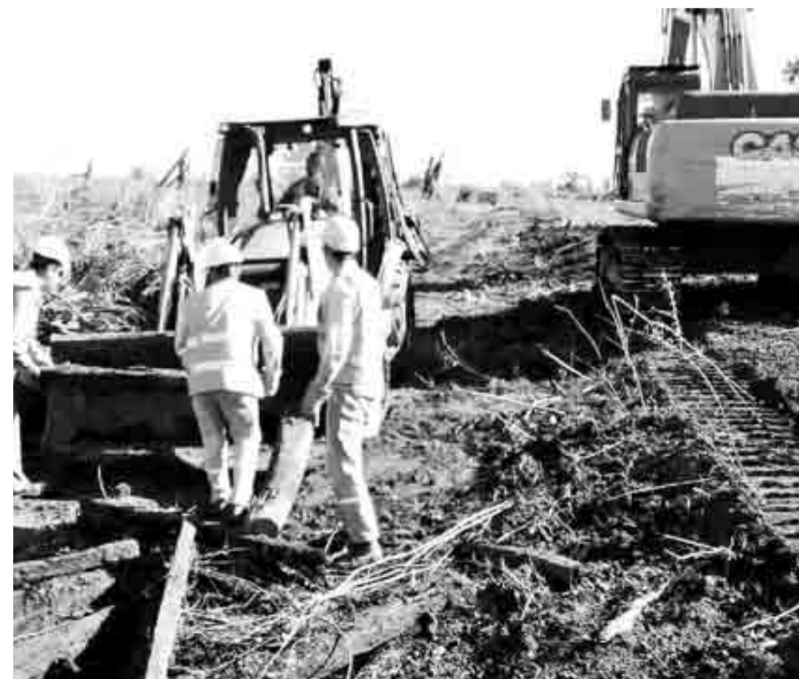
Con los trabajos, se potenciará la red ferroviaria del Belgrano Cargas, que une el norte argentino.